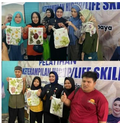
Gambar 3. Pelatihan Keterampilan/ life skill

Pelatihan merupakan bentuk implementasi nyata dari program yang dijalankan. Kegiatan ini berfokus pada peningkatan kapasitas orang tua dan anak penyandang disabilitas. Jenis pelatihan yang diberikan meliputi pelatihan life skill seperti ecoprint dan jumptuan, pelatihan kewirausahaan keluarga, serta pelatihan pendampingan anak seperti regulasi emosi dan terapi dasar.