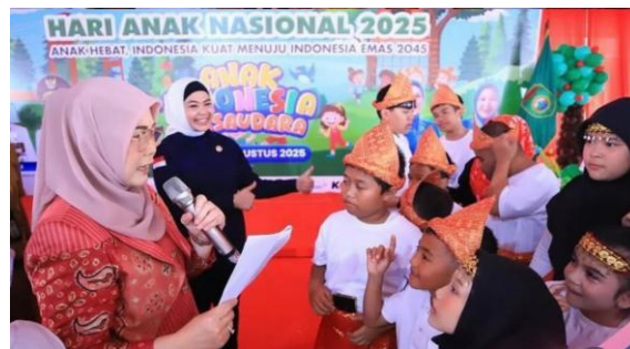
Gambar 8. Peringatan Hari Anak Nasional 2025

Hasil penelitian menunjukkan bahwa pendampingan memberikan manfaat nyata dan bersifat komprehensif, mencakup aspek psikologis, sosial, dan hukum. Meskipun terdapat kendala seperti keterbatasan anggaran, kurangnya tenaga penerjemah bahasa isyarat, serta penyesuaian waktu kegiatan, kendala tersebut dapat diatasi melalui koordinasi yang baik antar pihak.