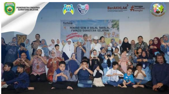
Gambar 7. Pentas Seni Peringatan Hari Autis Sedunia 2025