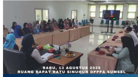
Gambar 2. Fasilitas Aula Dinas PPPA Sumsel untuk acara FORKESI

Temuan penelitian menunjukkan bahwa DPPPA tidak hanya berperan sebagai pelaksana program, tetapi juga sebagai pengarah kebijakan yang mendorong terciptanya sistem pelayanan yang lebih inklusif dan berkelanjutan.