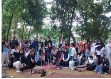
Gambar 1. Fun Walk dan Edutrip LRT Peringatan Hari Anak Disabilitas Internasional