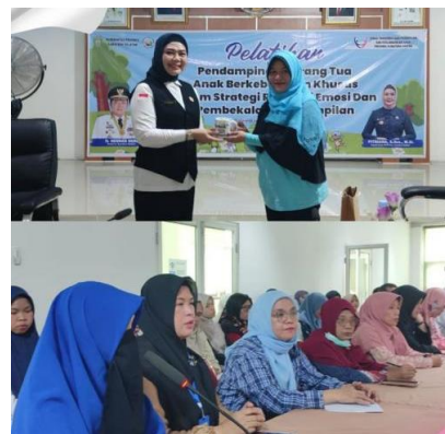
Gambar 4. Pelatihan Pendampingan Orang Tua (Strategi Regulasi Emosi)