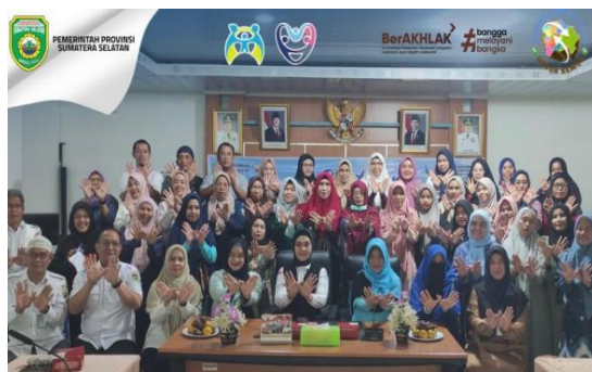
Gambar 6. Sosialisasi Pola Makan Sehat dan Bergizi Bagi Anak Disabilitas FORKESI

Temuan menunjukkan bahwa kegiatan sosialisasi dilaksanakan secara terkoordinasi, sesuai dengan kebutuhan kelompok sasaran, serta mampu meningkatkan pemahaman dan kesadaran orang tua dalam mengasuh anak disabilitas.