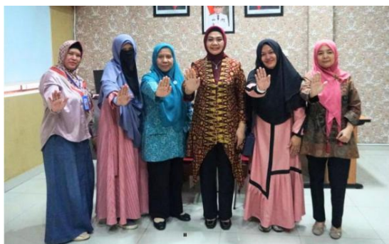
Gambar 5. Sosialisasi Pencegahan Kekerasan Pada Perempuan dan Anak Oleh DPPPA Provinsi Sumsel.

Sosialisasi berfungsi sebagai sarana edukasi dan penyebaran informasi kepada orang tua dan masyarakat. Kegiatan ini mencakup sosialisasi pola makan sehat bagi anak disabilitas, edukasi pencegahan kekerasan terhadap perempuan dan anak, serta penyuluhan pengasuhan dan pengendalian emosi.