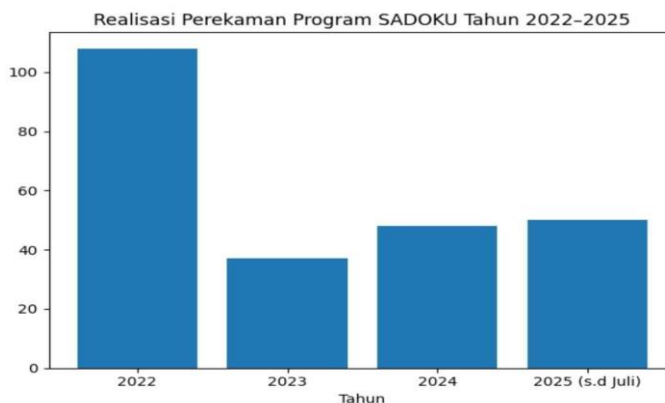
Gambar 1. Penerbitan kartu ktp menggunaka sadoku tahun 2022-2025