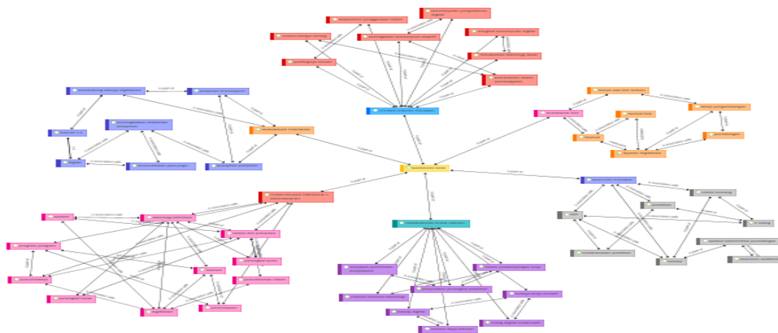
Gambar 1. Thema Kapasitas Sumber Daya Manusia